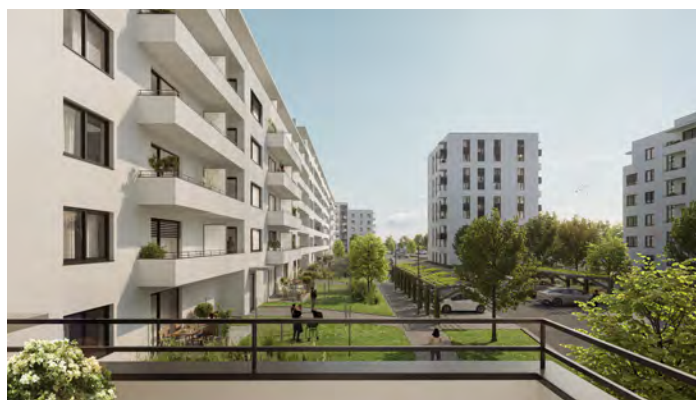
Residence Svratka Brno

Aktiva jsou diverzifikována v oblastech developerských projektů, nájemního bydlení, administrativních, skladovacích a výrobních areálů.